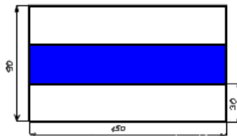
Szlaki piesze - wzór